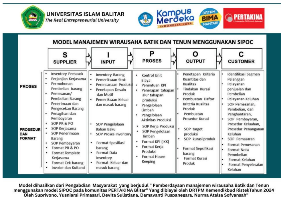
Gambar 5. Model Manajemen Wirausaha Batik dan Tenun Menggunakan SIPOC

Secara teknologi model ini mengintegrasikan modul dan software SIPOC. Pada tahap S ( Supplier ) secara on paper modul disediakan sebagai pedoman pelaksanaan kerja dan penggunaan aplikasi. Pada Modul S ( Supplier ) ini modul on paper meliputi definisi supplier, Standard Operating Procedures mengidentifikasi dan memilih supplier, dan tata cara penyimpanan data supplier. Supplier yang dimasukkan adalah pemasok bahan-bahan batik. Pada modul I ( Input ) ini modul on paper meliputi definisi input, Standard Operating Procedure Input , mengidentifikasi dan memilih bahan, asal bahan, jenis bahan, jumlah bahan, kualitas bahan, dan keamanan bahan. Pada Modul P ( Process ), modul on paper meliputi definisi proses, standard dan operating procedure process , dan aktivitas kunci proses. Pada modul O ( Output atau Produk), modul on paper meliputi definisi Output , Standard Operating Procedure kurasi output , dan aktivitas kunci output . Pada modul C ( Customer ), modul on paper meliputi definisi customer , menentukan kelompok customer segment , menentukan preferensi customer , preferensi channel, dan alternatif hubungan customer .