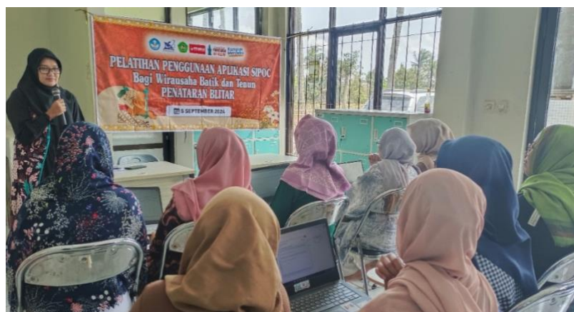
Gambar 4. Pelatihan Penggunaan Aplikasi SIPOC

Para peserta pelatihan selanjutnya menggunakan modul input pada aplikasi, yaitu menentukan bahan baku dan jenisnya, memilih bahan baku, memeriksa ketersediaan bahan baku, dan menentukan bahan baku yang dipakai (dengan mengisi form dan memilih data