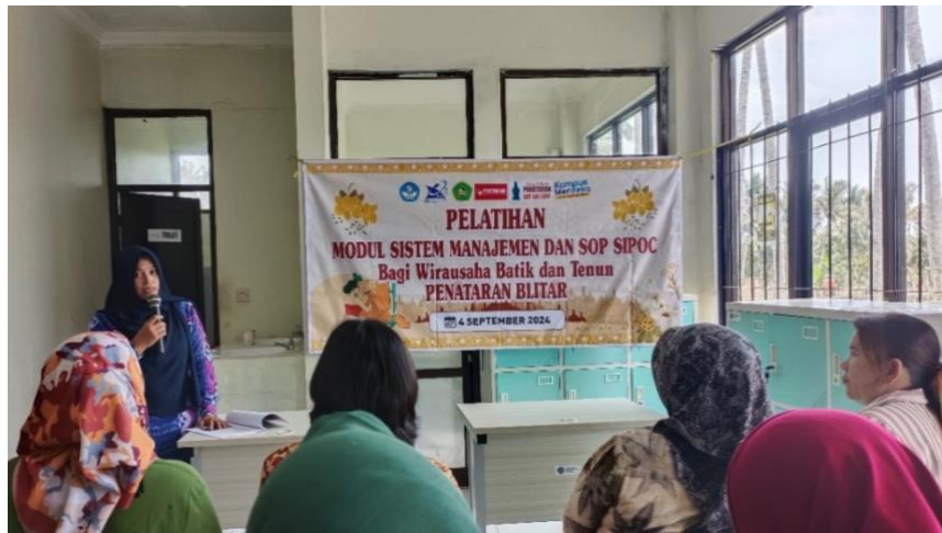
Gambar 3. Pelatihan Modul Sistem Manajemen dan SOP SIPOC

Kegiatan terakhir, yaitu Pelatihan Penggunaan Aplikasi SIPOC, dilaksanakan pada tanggal 5 September 2024. Pada tahap ini 20 pengrajin batik peserta pelatihan mulai menggunakan modul dan software aplikasi SIPOC untuk mengidentifikasi, memilih, dan menginput data supplier, mengisi dan memvalidasi permintaan pembelian ( Purchase Requisition ), serta melakukan pengorderan pembelian ( Prurchase Order ) bagi petugas pembelian) yang bisa dilihat pada gambar 4.