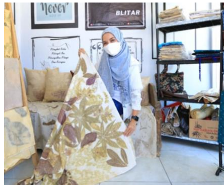
Gambar 1. Hasil produksi membatik pada Sharing Factory PERTAKINA yang dinamakan D'Weki (Destinasi Wisata Kain Indonesia)

Tujuan PKM ini terbagi menjadi empat, antara lain: 1) Memberdayakan masyarakat dengan membangun model manajemen SIPOC untuk wirausaha batik dan tenun PERTAKINA, 2) Memajukan para pengrajin batik dan tenun PERTAKINA melalui pelatihan model manajemen SIPOC, 3) Meningkatkan kualitas dan kuantitas produksi batik dan tenun PERTAKINA melalui penggunaan aplikasi model manajemen SIPOC, 4) Mengembangkan kemampuan kreatifitas membatik dan menenun bagi mahasiswa Universitas Islam Balitar melalui keterlibatan dalam Pengabdian Kepada Masyarakat ini.