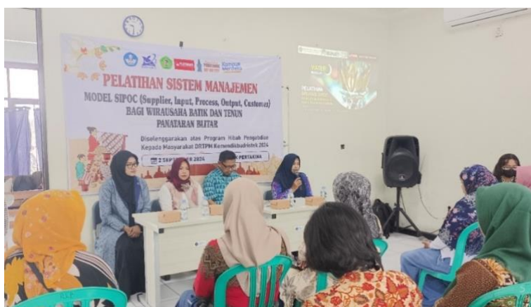
Gambar 2. Kegiatan Pelatihan Sistem Manajemen Model SIPOC

Kegiatan PKM ini berlangsung di Balai Pertakina, Kabupaten Blitar, selama tiga hari, yakni pada tanggal 2, 4, dan 5 September 2024. Kegiatan selama tiga hari ini terdiri atas tiga pelatihan, yaitu Pelatihan Sistem Manajemen Model SIPOC (Supplier, Input, Process, Output, Customer), Pelatihan Modul Sistem Manajemen dan SOP SIPOC dan Pelatihan Penggunaan Aplikasi SIPOC. Kegiatan Pelatihan Sistem Manajemen Model SIPOC ( Supplier, Input, Process, Output, Customer ) dilaksanakan pada tanggal 2 September 2024. Terdapat 20 peserta yang hadir dalam kegiatan ini, dan semuanya merupakan anggota PERTAKINA. Pelatihan ini diikuti dengan sangat antusias oleh para peserta, yang terbukti dari keaktifan para peserta selama sesi tanya jawab berlangsung, seperti pada gambar 2.