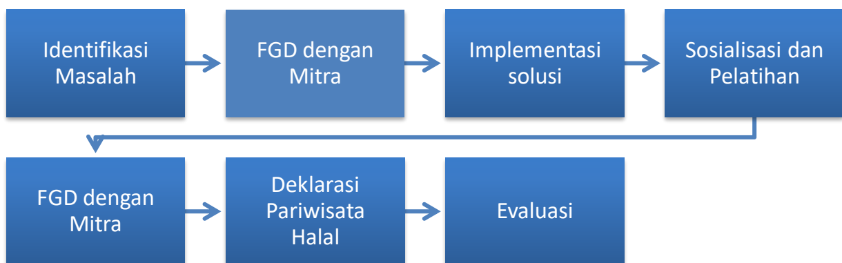
Gambar 1. Alur Pengabdian Masyarakat di Desa Ngadipuro

Keberhasilan pengabdian pada masyarakat dapat diukur dengan berbagai faktor dan indikator. Berikut adalah beberapa ukuran pengabdian masyarakat yang digunakan untuk mengukur keberhasilan pengabdian pada masyarakat kepada mitra pokdarwis “dewata puro” di Desa Ngadipuro: