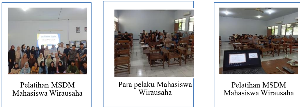
Gambar 1 : Beberapa Aktivitas Kegiatan Pengabdian

Beberapa aktivitas selama kegiatan pengabdian kepada masyarakat dapat dilihat pada Gambar tersebut di atas. Selama kegiatan berlangsung, peserta pengabdian merasa antusias dan mengikuti semua tahapan proses sampai selesai. Pelaksanaan kegiatan pengabdian masyarakat melalui dua metode yaitu sosialisasi dan Pelatihan secara langsung pada pelaku mahasiswa wirausaha di Universitas Tulungagung, dimana kegiatan ini bertujuan untuk memberikan sosialisasi dan pelatihan yang sederhana tentang MSDM kepada mahasiswa wirausaha agar mereka dapat melaksanakan tugas dan tanggung jawab dengan baik, serta terhindar dari penyalahgunaan wewenang. Solusi yang ditawarkan melalui pelatihan pengawasan dan pendampingan ini.