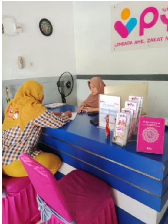
Gambar 2. Wawancara dan Perizinan dengan Pengurus Panti Asuhan