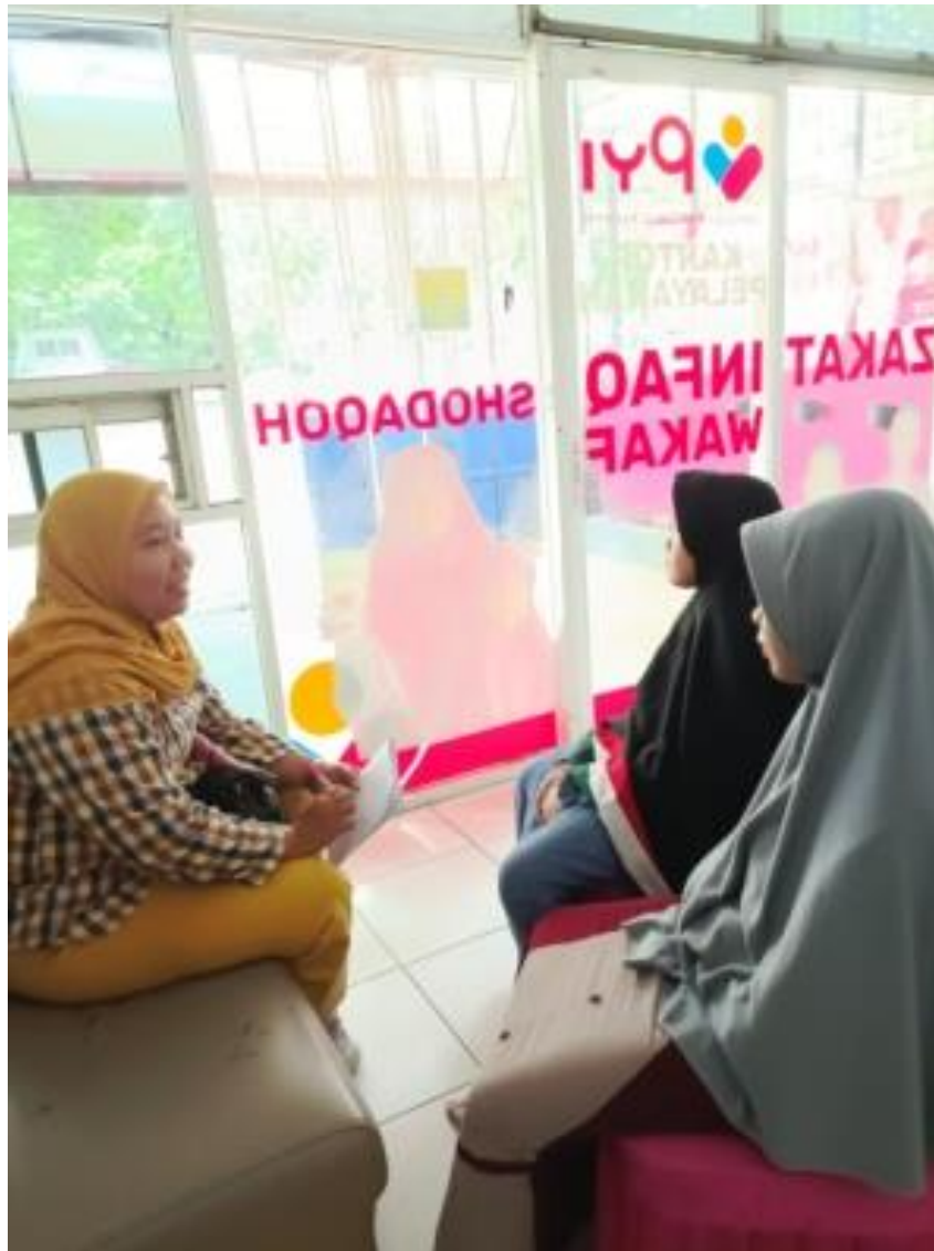
Gambar 3. Pelaksanaan Kegiatan Psikoedukasi Meningkatkan Self-esteem

Evaluasi dilakukan pada saat proses pelaksanaan kegiatan dan setelah kegiatan, berdasarkan hasil observasi pada saat pelaksanaan psikoedukasi diketahui bahwa peserta mendengarkan dengan seksama dan mau untuk bercerita dan bertanya mengenai keresahan yang dialaminya sehingga dapat dikatakan suasana cukup kondusif dengan adanya interaksi dua arah. Setelah pelaksanaan kegiatan evaluasi dilakukan dengan cara wawancara untuk mengetahui sejauh mana mitra mampu menyerap materi yang diberikan dan respon terhadap materi tersebut.