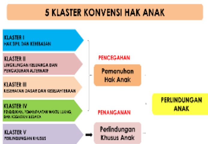
Gambar 2 Klaster Konvensi Hak Anak

Selain itu dalam rangka memenuhi kewajiban dalam pemenuhan hak anak, maka Hak Anak yang dimaksud dalam kerangka Konvensi Hak Anak yang merupakan kebijakan PPA dikelompokkan kedalam lima Klaster, yaitu: (1) Hak Sipil dan Kebebasan; (2) Lingkungan Keluarga dan Pengasuhan Alternatif; (3) Kesehatan Dasar dan Kesejahteraan; (4) Pendidikan, Pemanfaatan Waktu Luang dan Kegiatan Budaya; dan (5) Perlindungan Khusus. Berkaitan dengan hal ini maka kabupaten dituntut untuk melakukan pencegahan dan penanganan guna merumuskan serta menyelenggarakan regulasi dengan memiliki dan memperkuat perangkat peraturan daerah yang mampu memberikan kepastian hukum dan kejelasan tanggungjawab berbagai pihak yang berkompeten dalam memberikan pelayanan bagi setiap anak dengan memfokuskan pada kebutuhan akan kesejahteraan dan perlindungan bagi setiap anak, sehingga terwujud perlindungan anak.